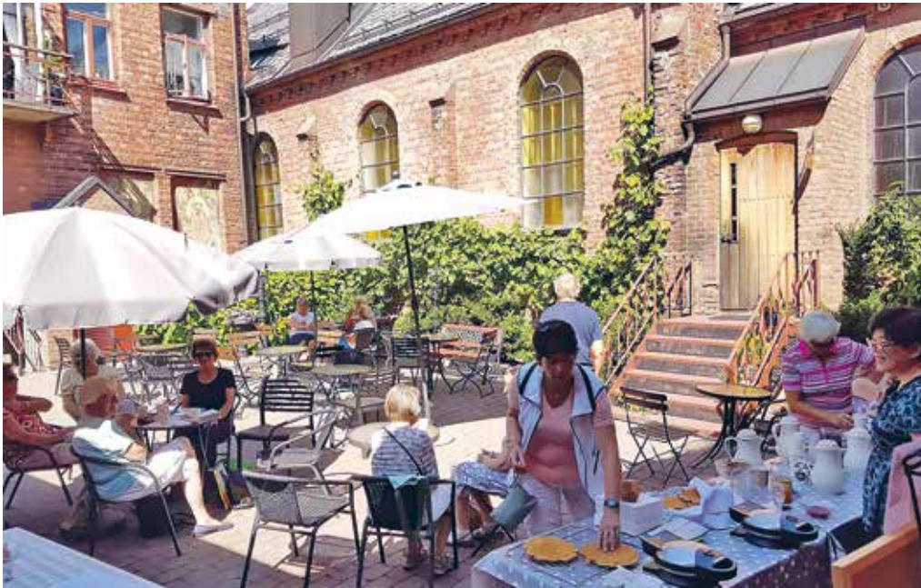
Lørdag i bakgården med salg av vafler og kaffe.

settes det fram bord og stoler, det stekes vafler og kokes kaffe, og blant blomstrende hortensiaer og bugnende drueklaser kan folk sette seg ned, kjøpe seg noe godt å spise for en rimelig penge og få en god prat. Her kan de også smake på druene når høsten kommer. Om vinteren er samlingene i biblioteket som ligger i tilknytning til bakgården.