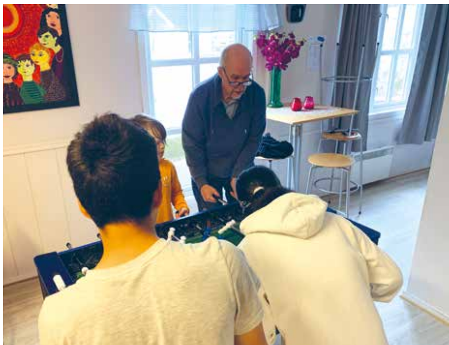
Fotballspill fenger alltid.

Ungdomsklubben startet for 11 år siden som et samarbeid mellom Metodistkirken og Den norske kirke. Ved siden av idrettslaget er det i dag det eneste faste tilbud til ungdom i lokalmiljøet,.