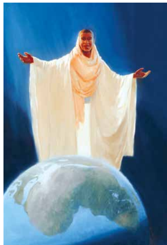
Den latinamerikanske Jesus

Allmektige Gud, din Sønn, vår Frelser, ble født av en hebraisk mor, gledet seg over troen hos en syrisk kvinne, og en romersk soldat, tok imot grekere som oppsøkte ham og lot en afrikaner bære korset for ham. Lær oss slik å betrakte alle mennesker som medarvinger til ditt rike. ♣