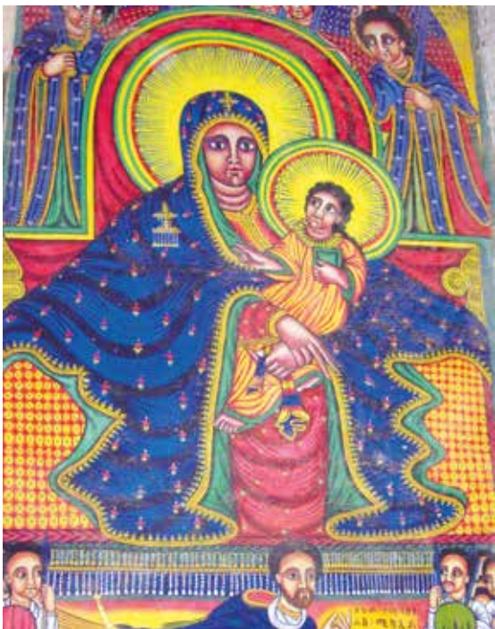
Den afrikanske Jesus

... formidlingen av evangeliet – gjennom forkynnelse og diakoni – vil alltid bære preg av den lokale konteksten. Dette er i høyeste grad tilfelle i det misjonsarbeidet vi er en del av i dag.