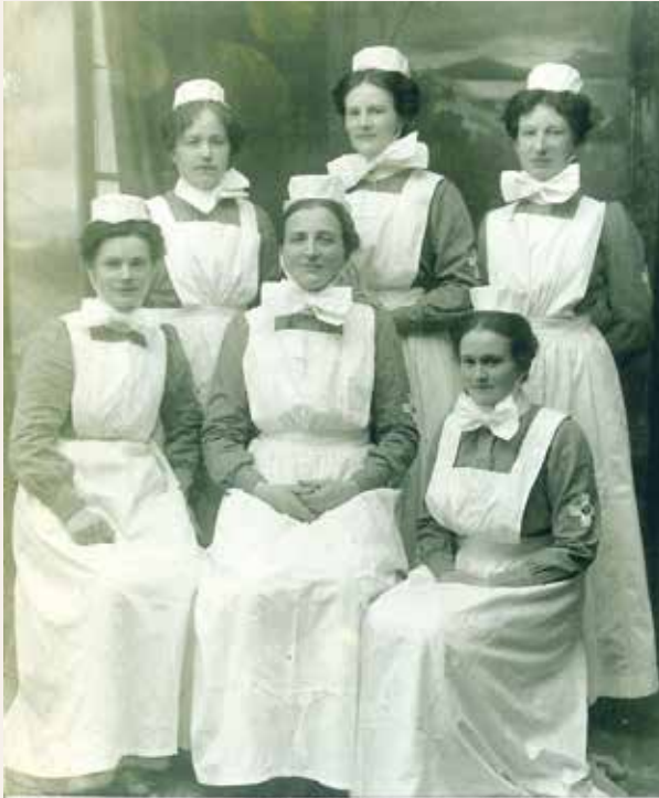
Betaniensøstre ved sykehuset, H.fest 1911

Under evakueringen av Finnmark som ble utsatt for «den brente jords taktikk» i 1944, var Betaniensykepleierne som hadde ansvaret for Hammerfest sykehus, sentrale i evakueringen av pasientene med små fiskebåter under meget krevende forhold.