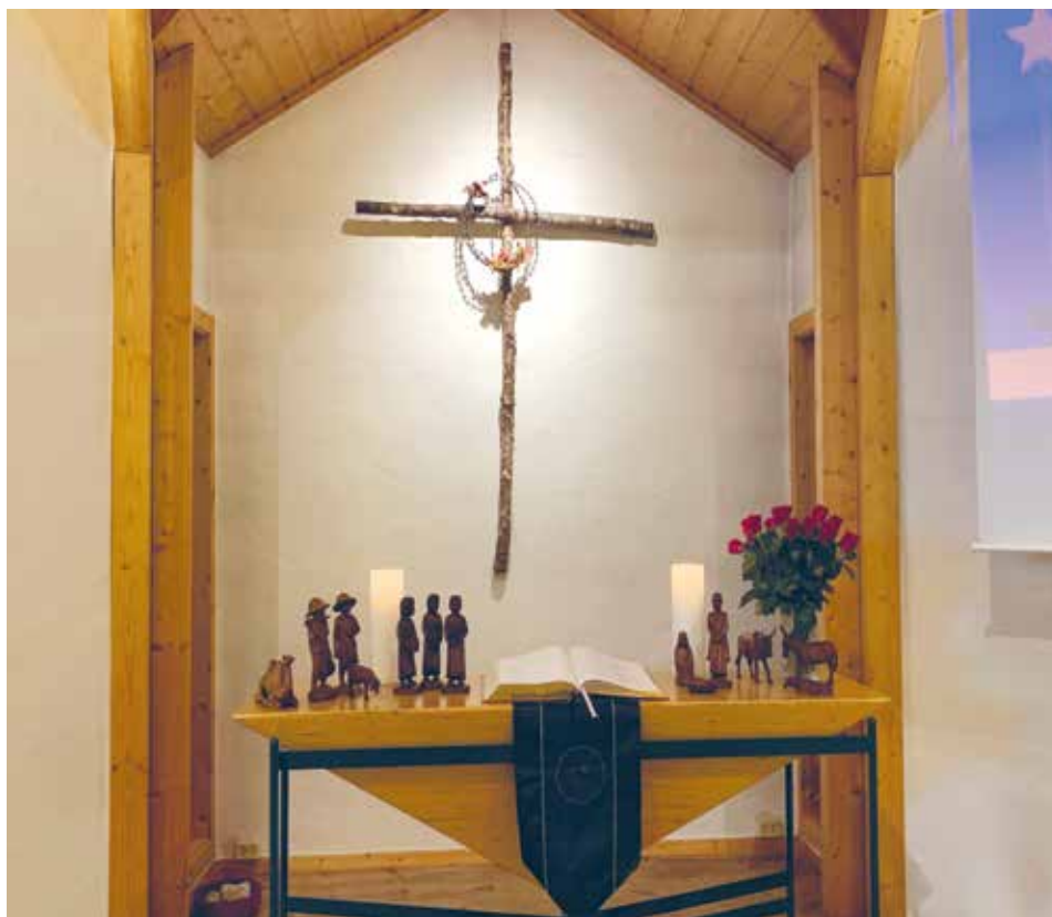
Gudstjenesten er stedet hvor aktivitetene bringes sammen.

Vi ønsker å være en kirke på nye måter. ❖