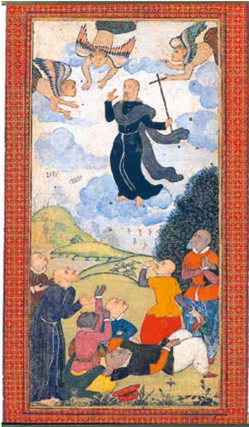
Den asiatiske Jesus

deltar fullt ut i det menneskelige fellesskap. Han ble født som menneske, vokste opp som mann og døde som alle mennesker gjør. Han blir sett på som grunnleggeren av et nytt samfunn, kirken, der han både er grunnleggeren og den førstefødte, den eldre bror.