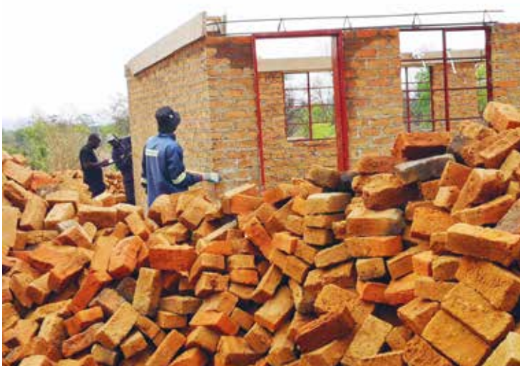
De innleide håndtverkerne gir opplæring til lokale ungdommer.