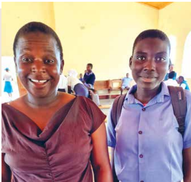
Precious (t.h.) og læreren.

Precious var veldig forelsket i kjæresten sin, en jevnaldrende gutt fra samme landsby. Noen foreslo at de skulle gifte seg da de skjønnte at de skulle ha barn sammen. Da satt mormoren til Precious foten ned. Hun skulle ikke ha noe av at hennes Precious skulle bli en tenåringsbrud, selv om det er vanlig i