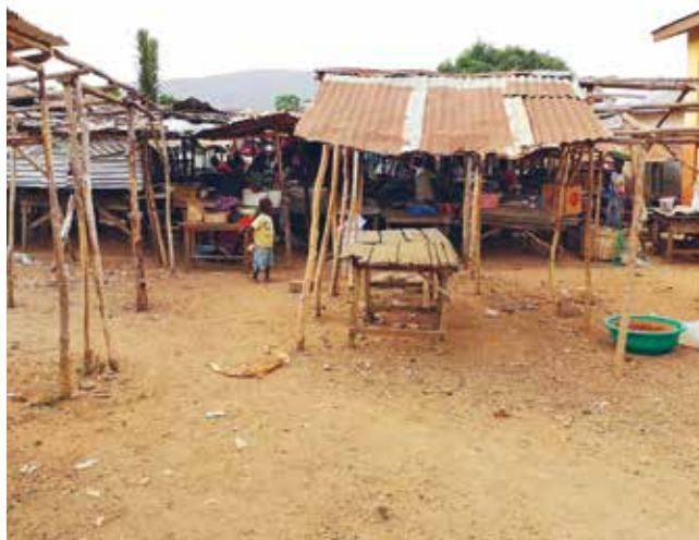
Det gamle markedet i Panguma.

er et godt misjonsprosjekt for menigheten vår i Horten. De har selv et nært forhold til markens grøde! I kirkens bakgård har de en blomstrende oase, og ikke minst, mange druestokker! Langs den ene solveggen på langsiden av kirken strekker det seg ranker med druer oppover, og tett bortover. Her høstes det i flere omganger utover høsten, og druene blir saftet og brukt til nattverdsvin på guds-