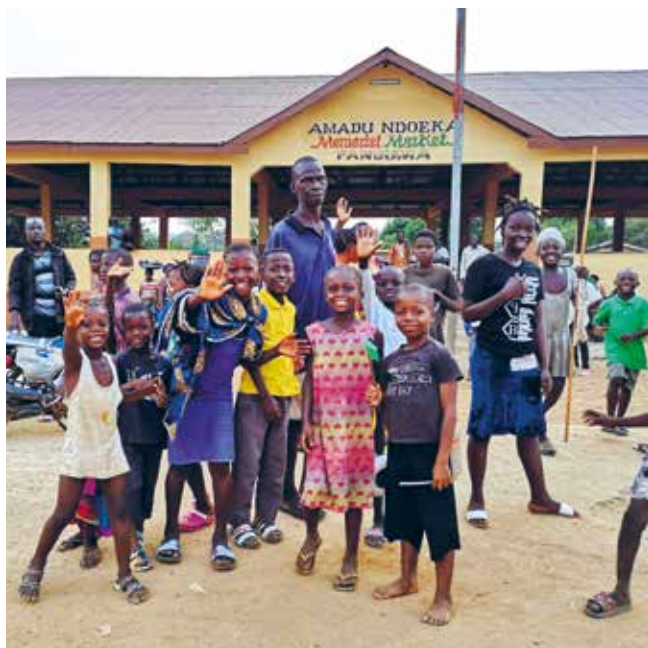
Alle i Panguma gleder seg over det nye markedet.