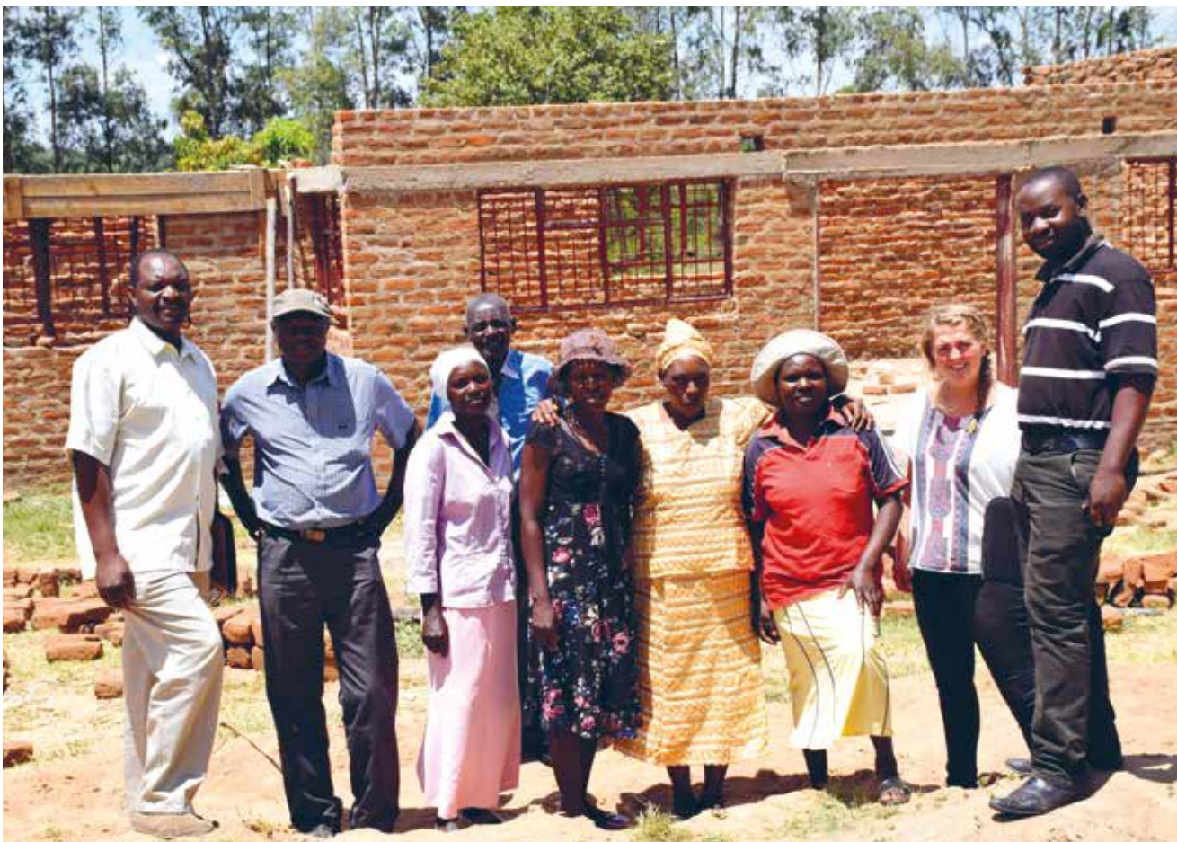
Prosjektkomiteen i Mhende, Zimbabwe.

klimatilpasninger i prosjekter og grønne prosjekter kan forsterkes enda mer i tiden fremover.